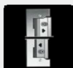
FALCA AJUSTABILĂ 4MM